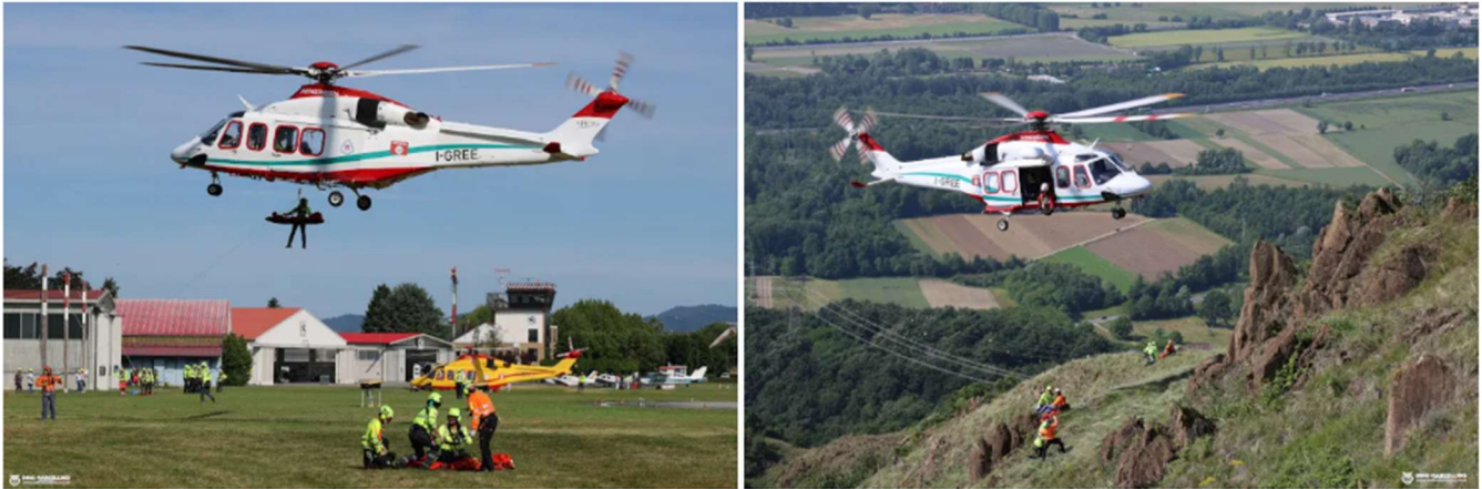
Attività sull'Aeroporto Torino-Aeritalia ed al Monte Musinè

Al termine della preselezione, sulla base dei posti disponibili, accedono al corso di formazione i candidati che hanno dimostrato il miglior profilo complessivo. Con il corso 2026, appena concluso, sono stati formati 15 medici e 30 infermieri, che nei prossimi tre anni entreranno progressivamente in servizio presso le basi regionali di elisoccorso.